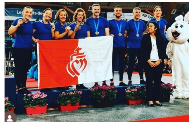
Elan Mortagnais Fédérale A Adultes (25 ans et +)