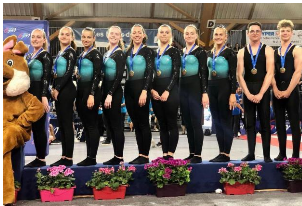
Beauséjour Les Sables Nationale B Mixte