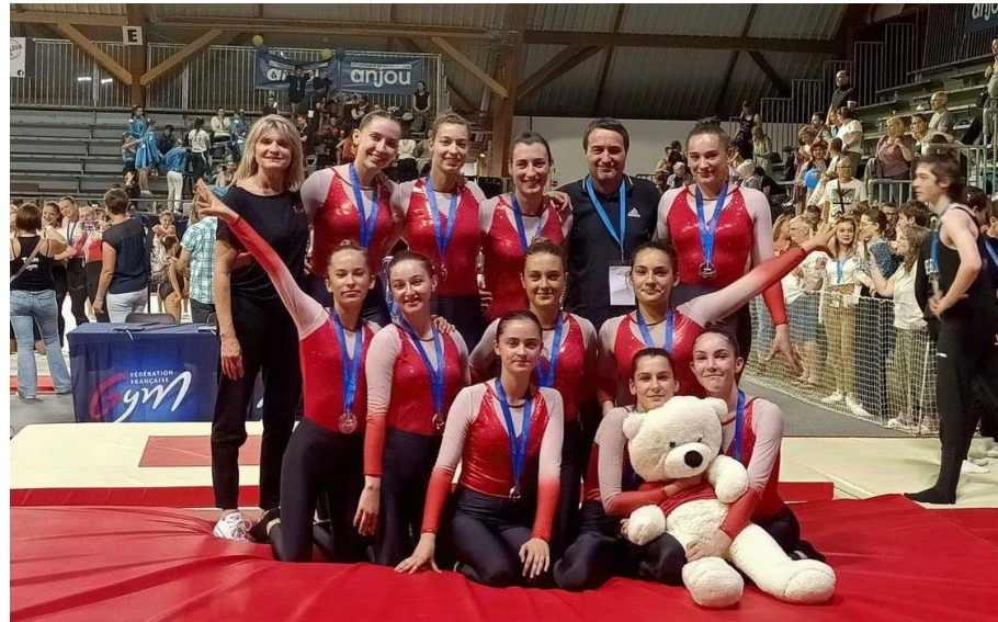
ASCA Fédérale A Féminine