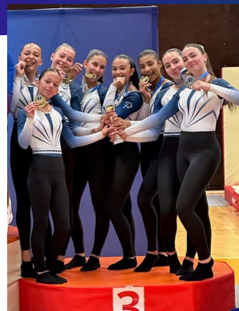
LA PERSEVERANTE LE MANS FED A Féminine FINALE A