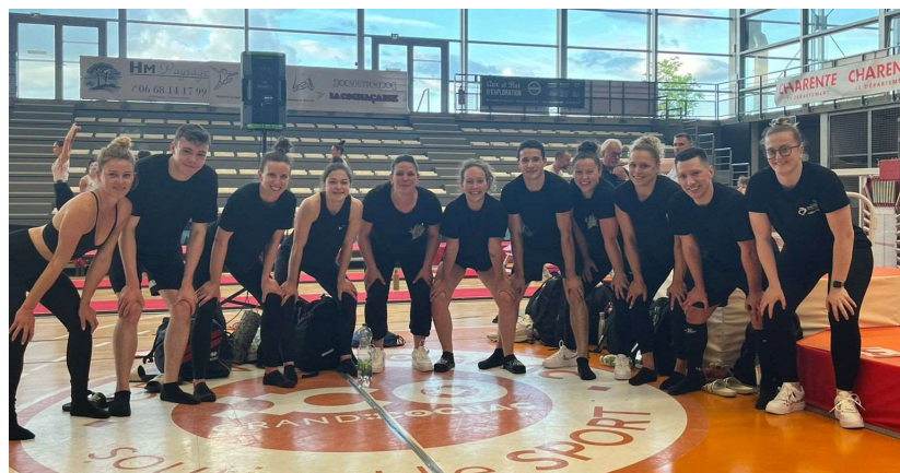
ANGERS GYM EUROPE