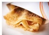
GATEAUX, FRIANDISES, CREPES À partir de 0,50 €