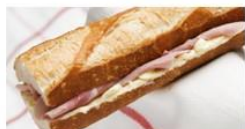
SANDWICHES A partir de 2,50 €