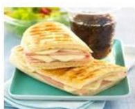
CROQUES 3,00 €